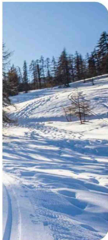
Le frisson du Grand Nord à portée de skis.