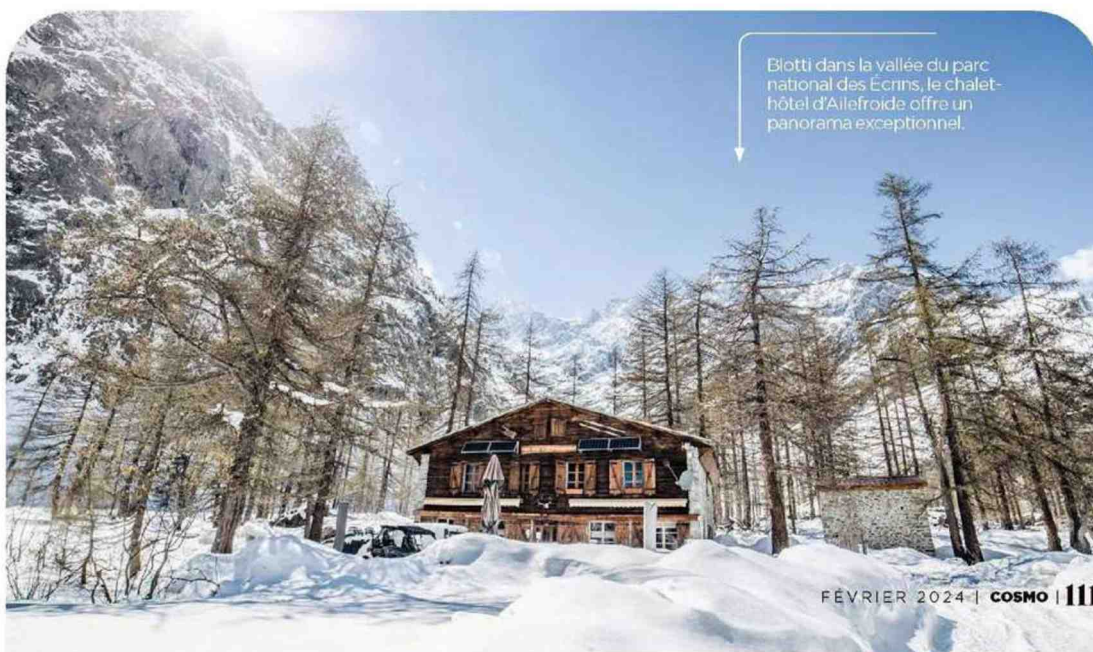
Blotti dans la vallée du parc national des Ecrins, le chalet-hôtel d'Ailefroide offre un panorama exceptionnel.

Dans la vallée la plus secrète et sauvage du parc national des Ecrins, à Pelvoux, se niche le chalet-hôtel d'Ailefroide, accessible seulement en raquettes ou en ski de randonnée: sportif mais magique! Une fois sur place, on se retrouve dans une bâtisse construite en 1896 dont chaque chambre nous offre une vue à couper le souffle sur le levé ou le coucher de soleil. Au milieu d'un paysage enneigé, on profite à fond du silence... chalet-hotel-ailefroide.com